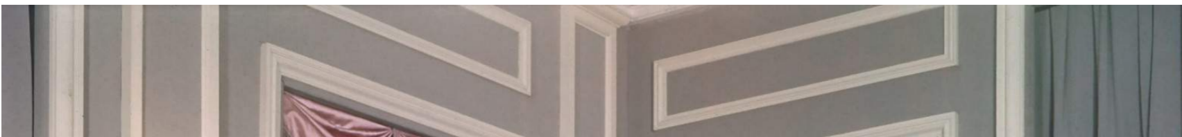
Liszt dress — SS1950