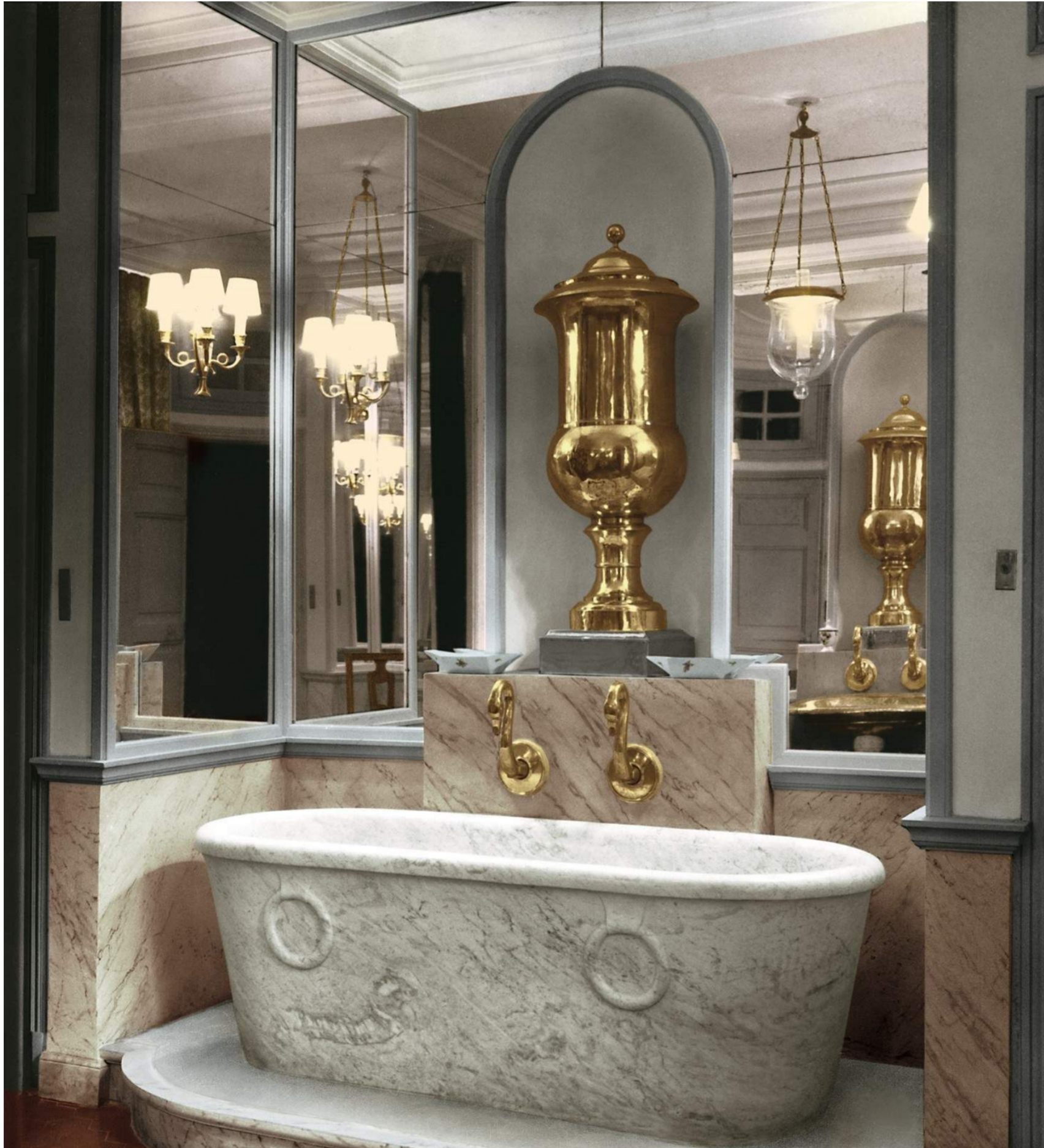
Bathroom design by architect Andrei Svetchine