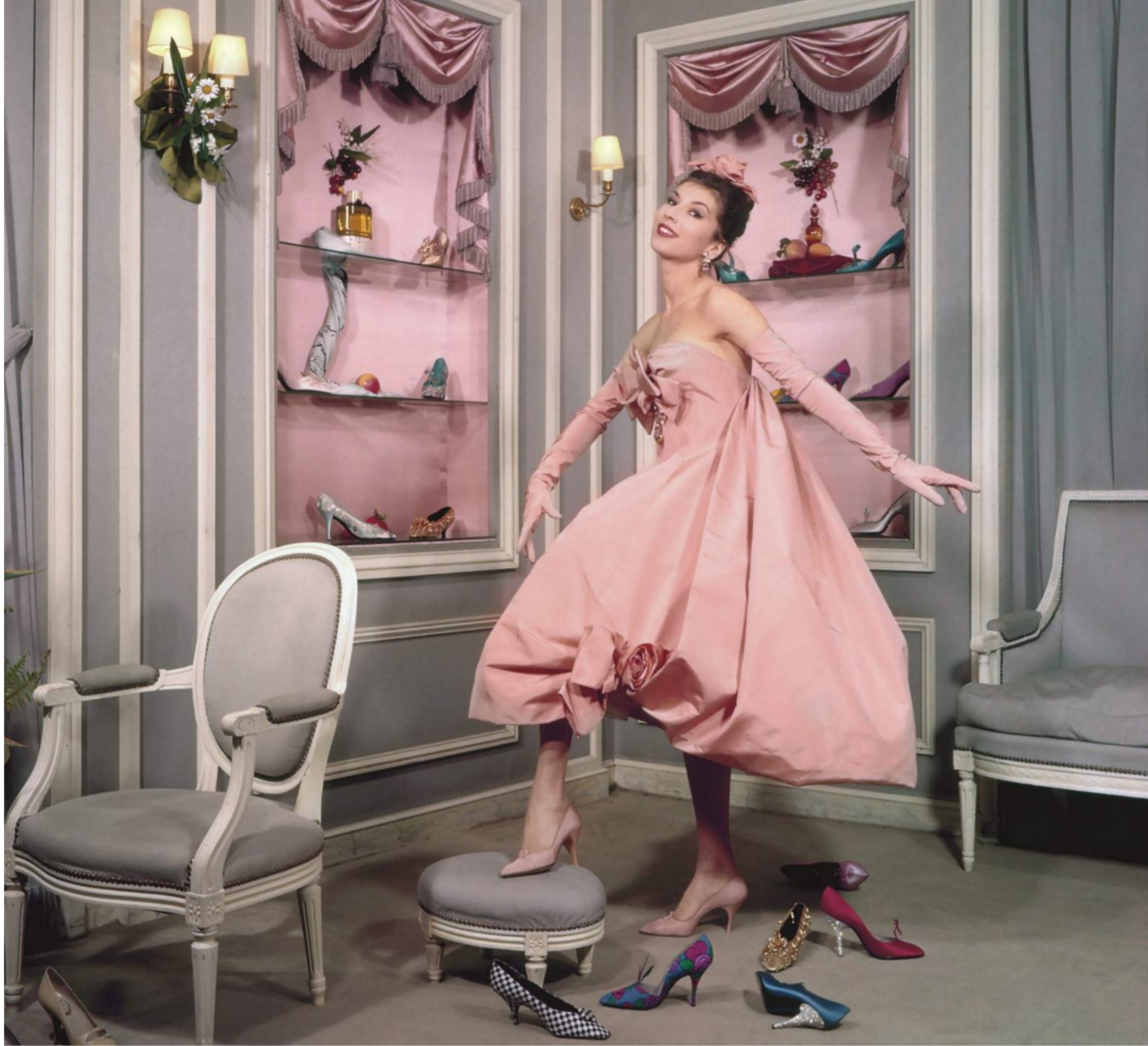
Aurore dress — SS1958

“在一间与自己格格不入的屋里生活，简直像穿着别人的衣服。”Christian Dior曾于回忆录中，提及居家装潢与自身个性切合的重要性。