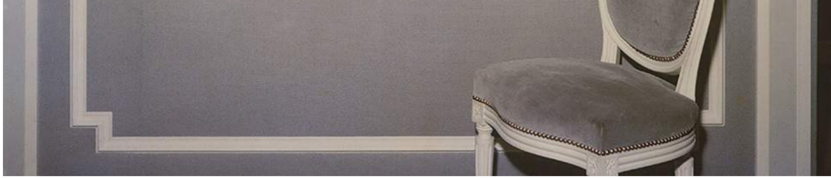
Christian Dior Perfume Boutique