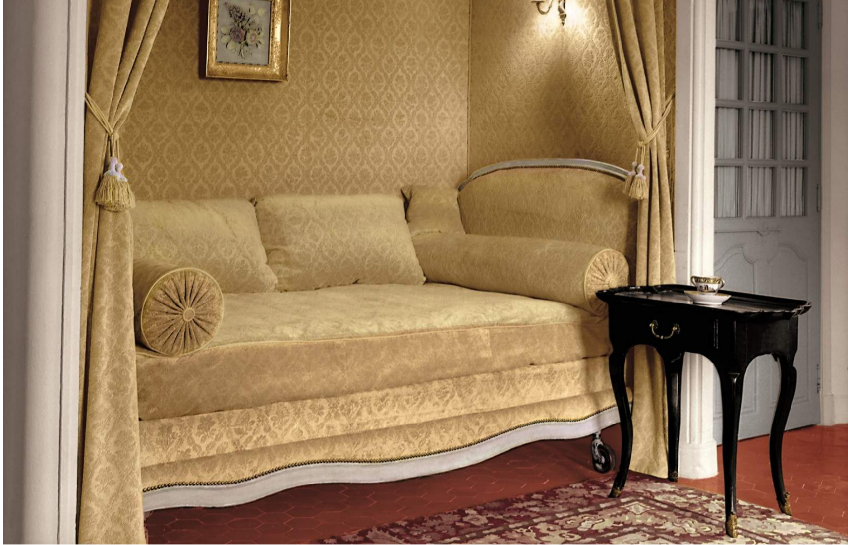
Christian Dior's room in La Colle Noire