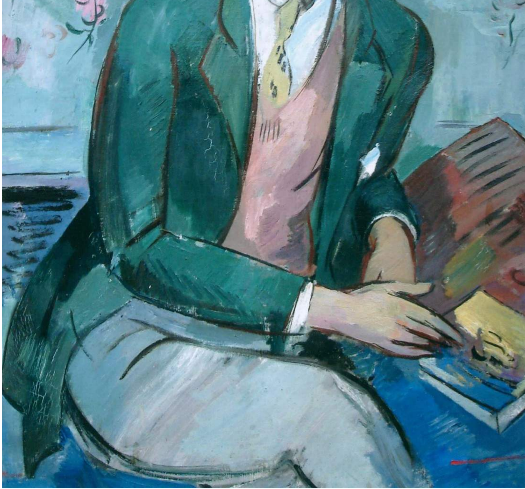
Portrait of Christian Dior by Paul Strecker, 1928