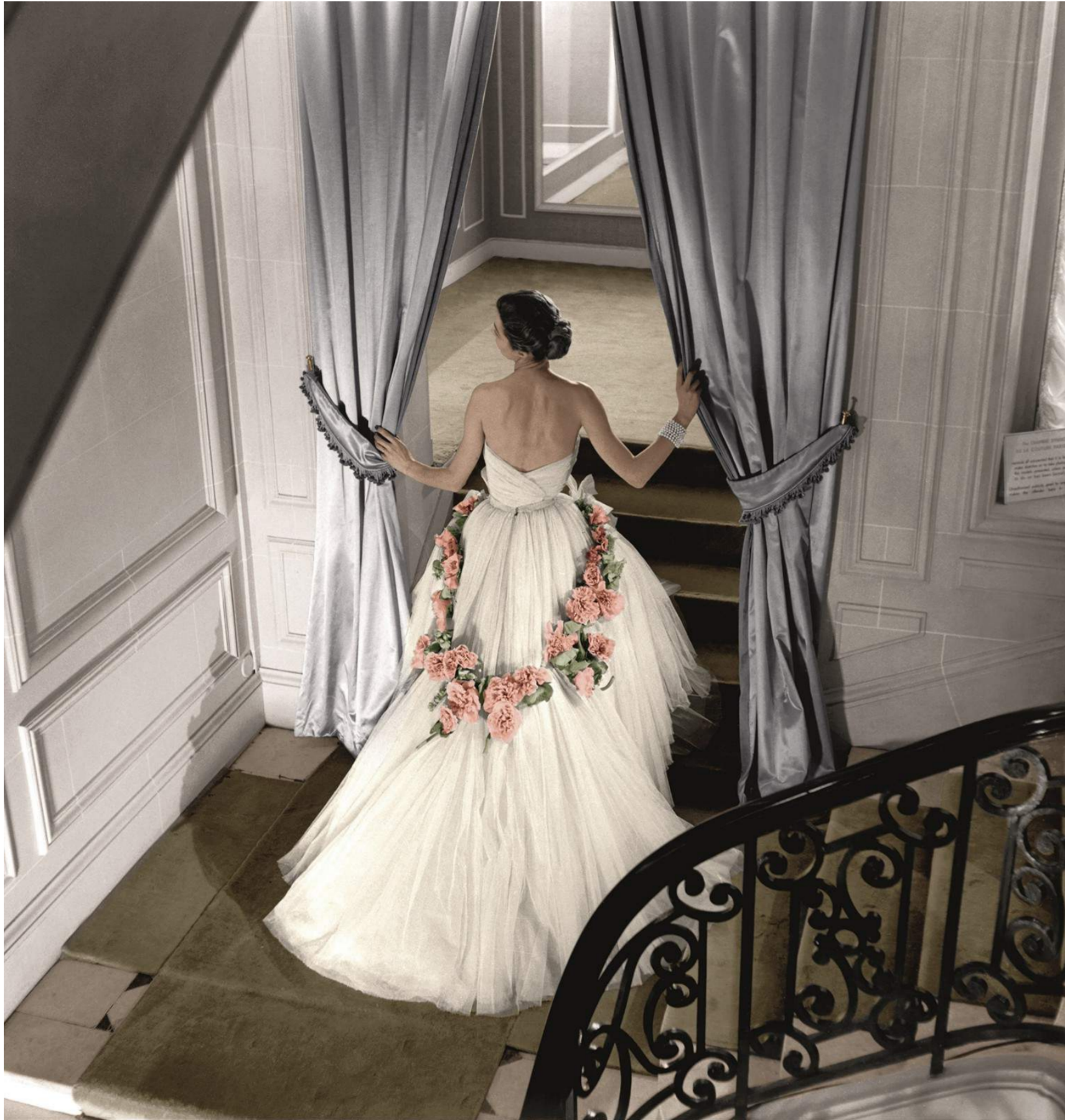
Tableau final dress — SS1951