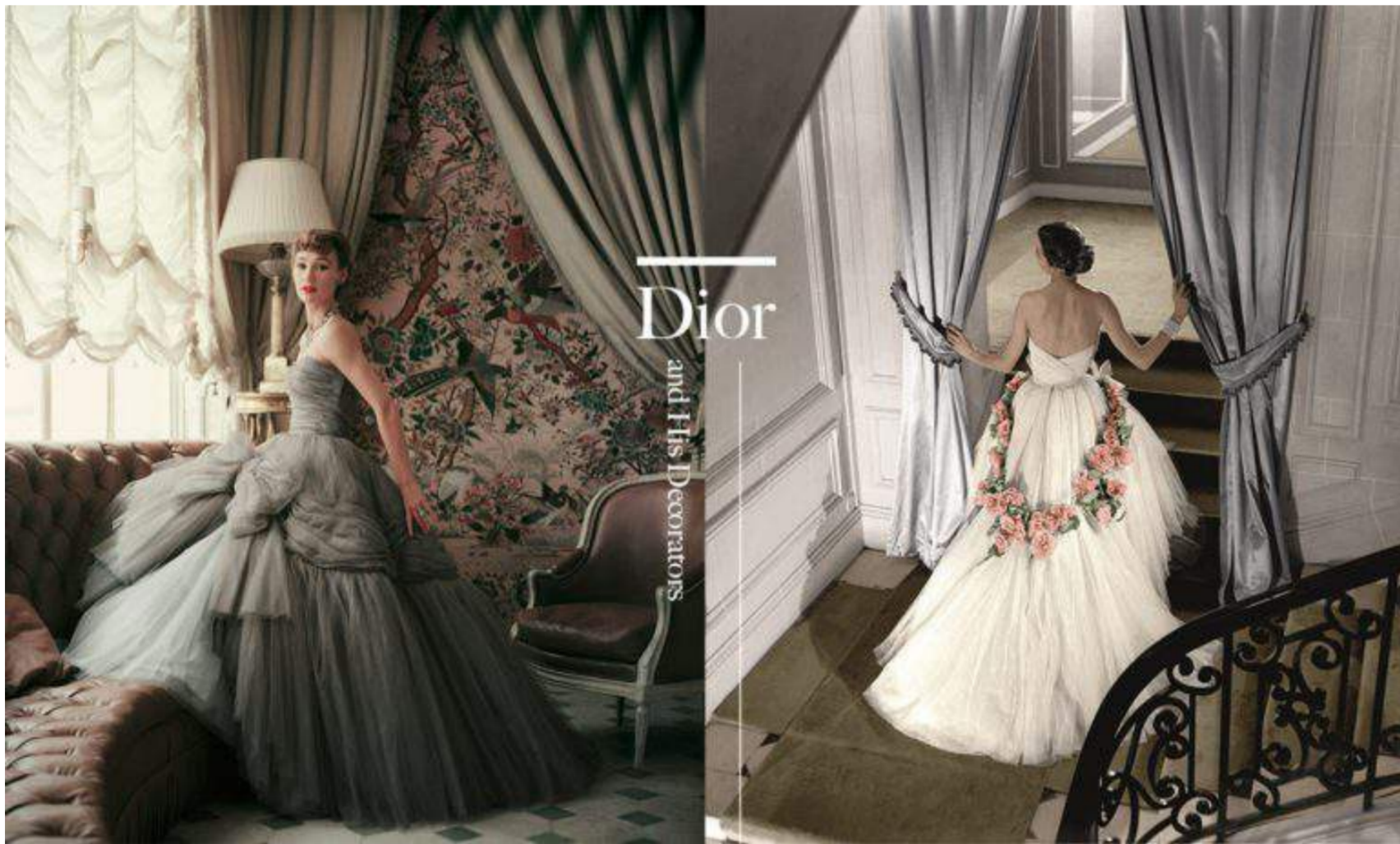
Dior and His Decorators

时尚与家饰设计之间可谓渊源匪浅，因工作型态改变（如自由工作者），导致时尚品牌入主家饰产业的趋势兴起，时尚与居家空间日渐形成一股紧密的连结，可被视为设计精神的基因转殖，而住家的型态与装潢也同时反映出屋主的人格与喜好，甚至深刻地影响着屋主的审美观点。