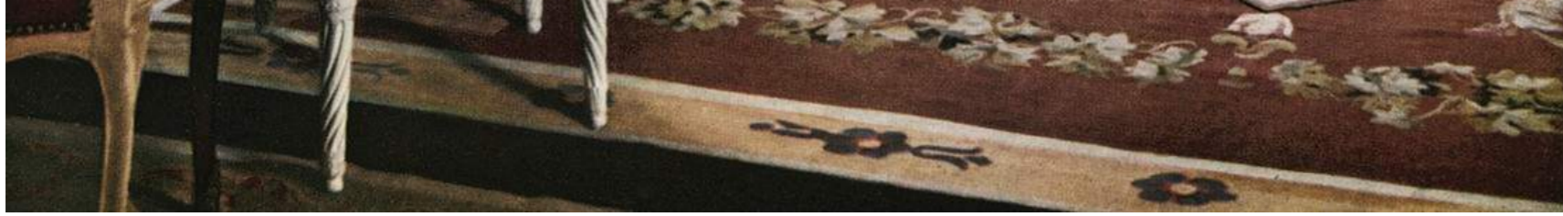
Le Salon decorated by Georges Geffroy