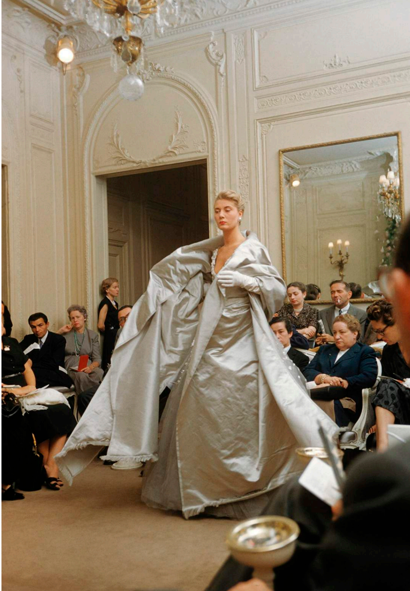
France presents Dior's evening ensemble called "Chambord", Autumn/Winter Collection H-line, 1954