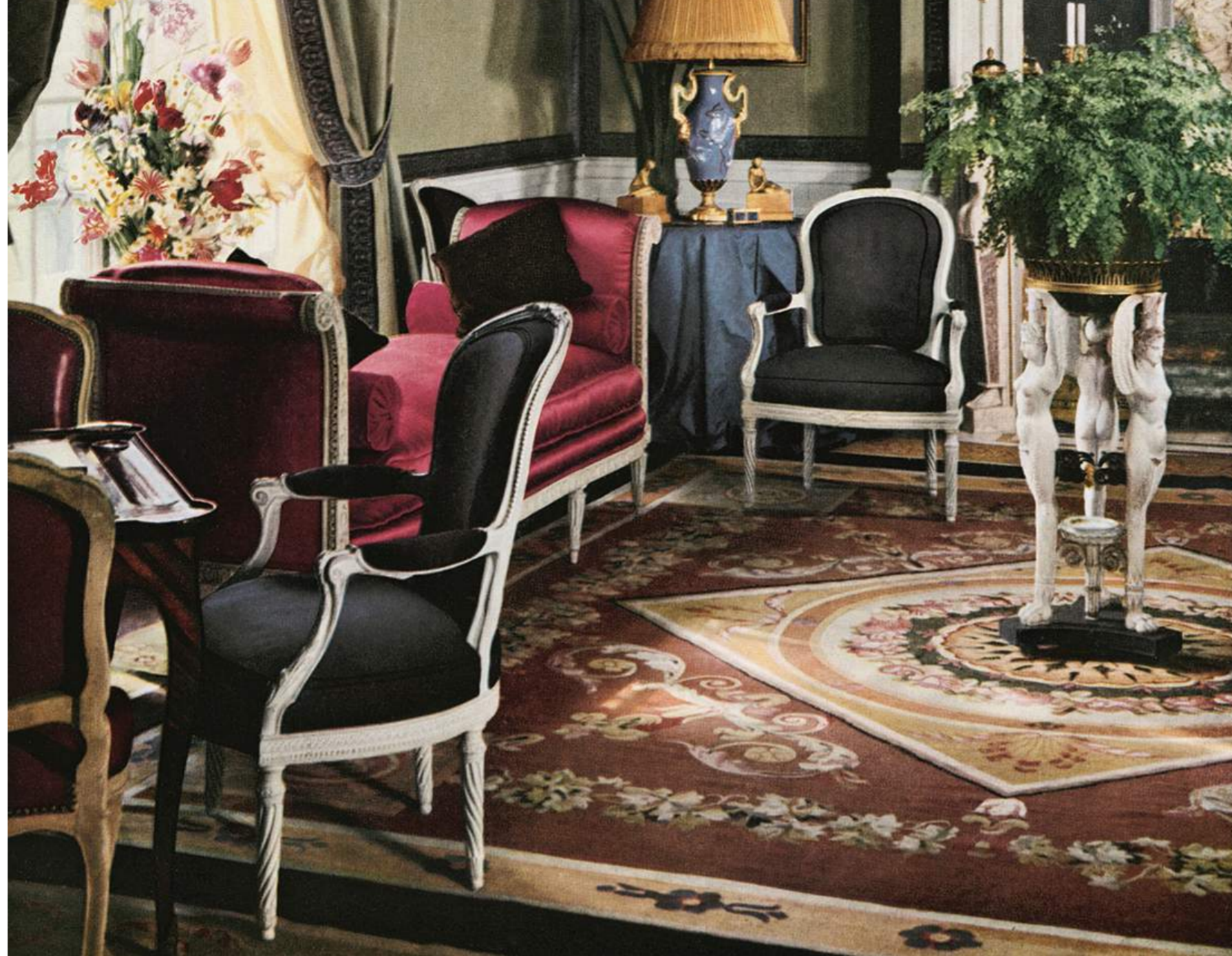
Le Salon decorated by Georges Geffroy