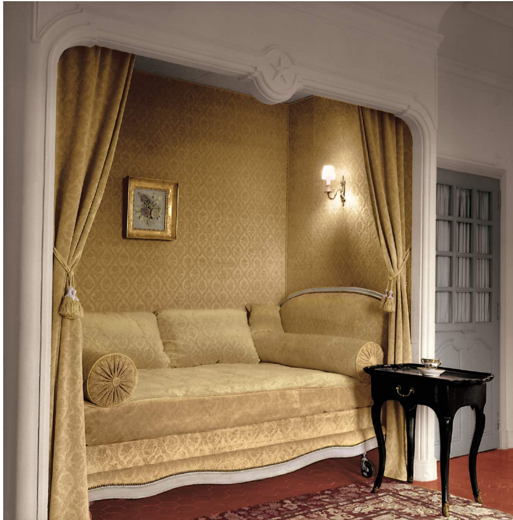
Christian Dior's room in La Colle Noire