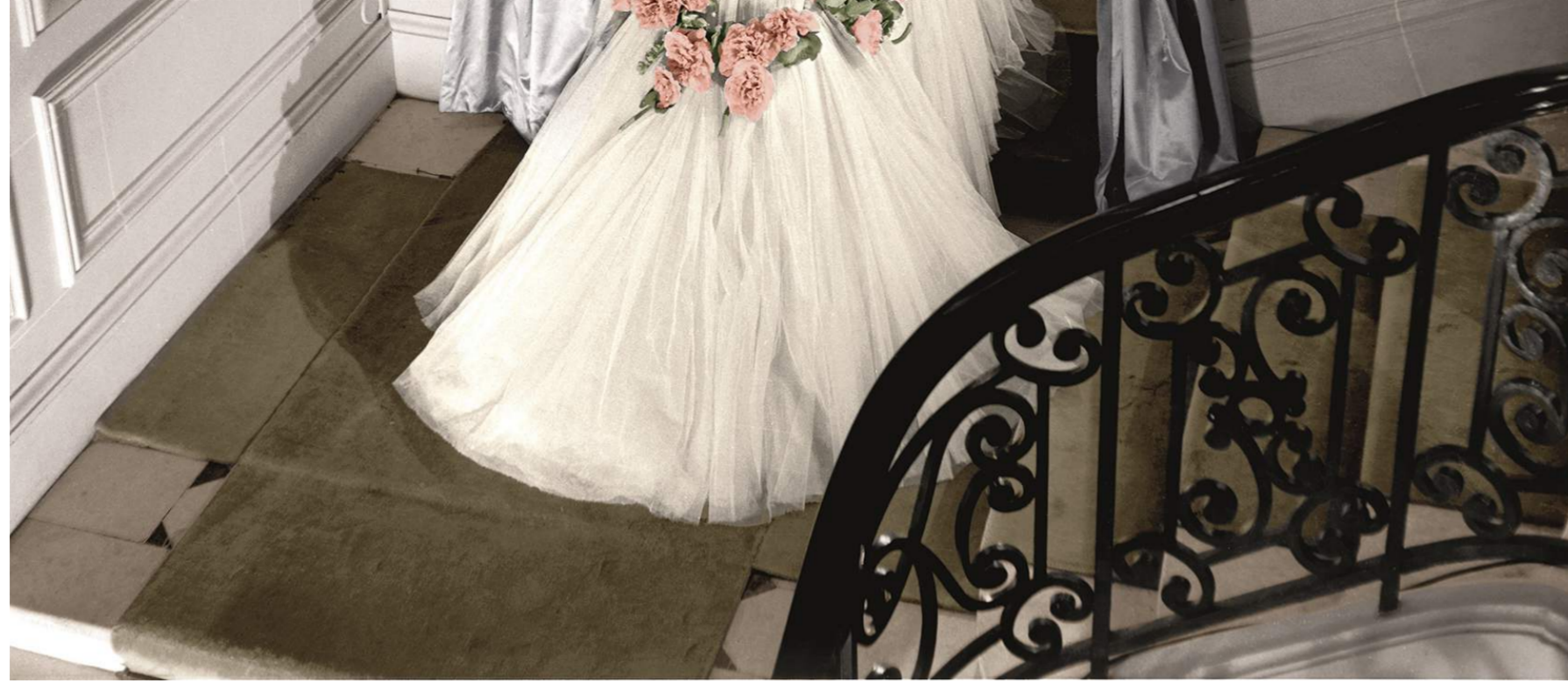
Tableau final dress – SS1951