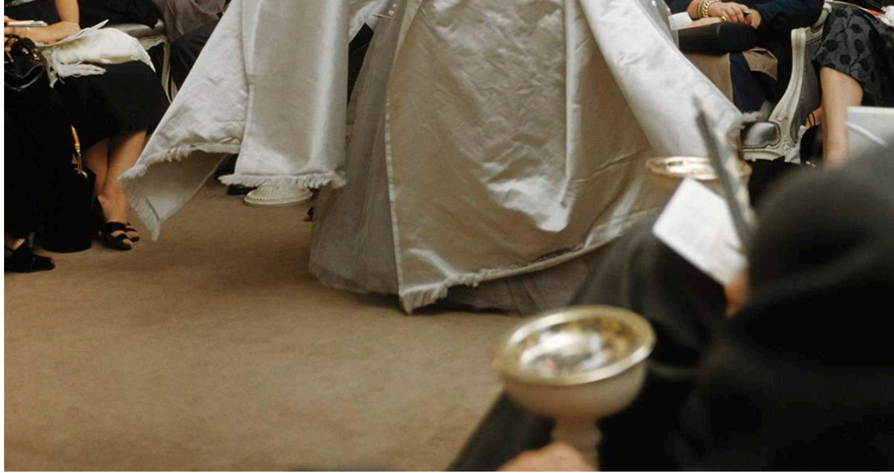
France presents Dior's evening ensemble called "Chambord", Autumn/Winter Collection H-line, 1954