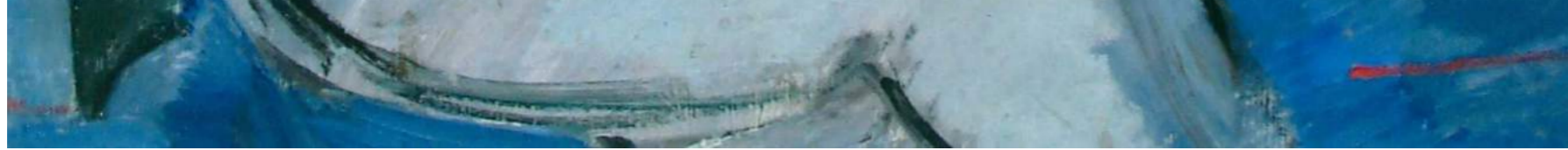
Portrait of Christian Dior by Paul Strecker, 1928