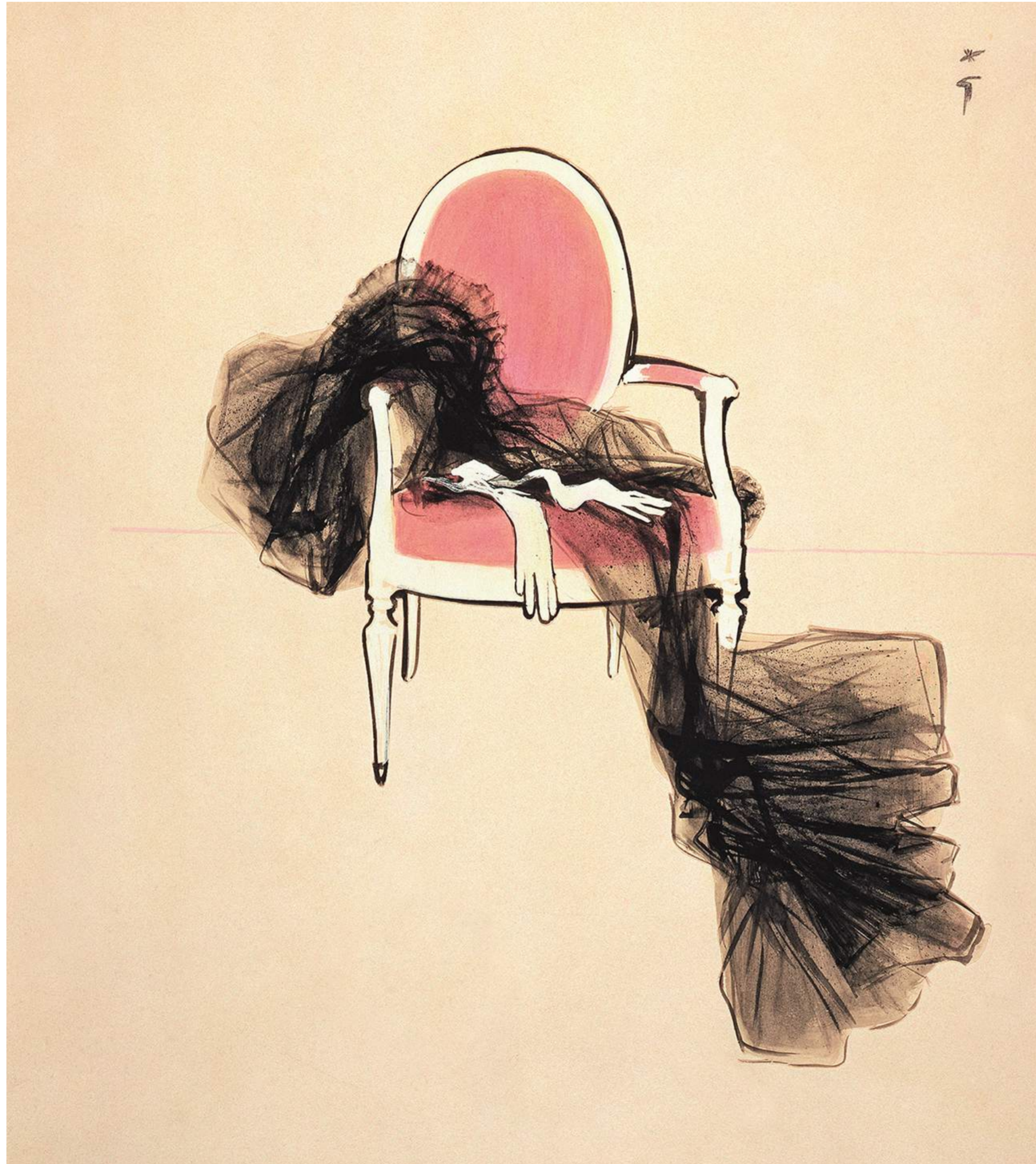
René Gruau for Dior

《Dior and His Decorators》除了刻劃3位時尚與設計大師充滿創意的合作結晶，更反映了那年代的創作精神，冥冥之中拓展出Dior匠心獨運的美學視野，無論是高雅簡約或是奢華氣派，皆