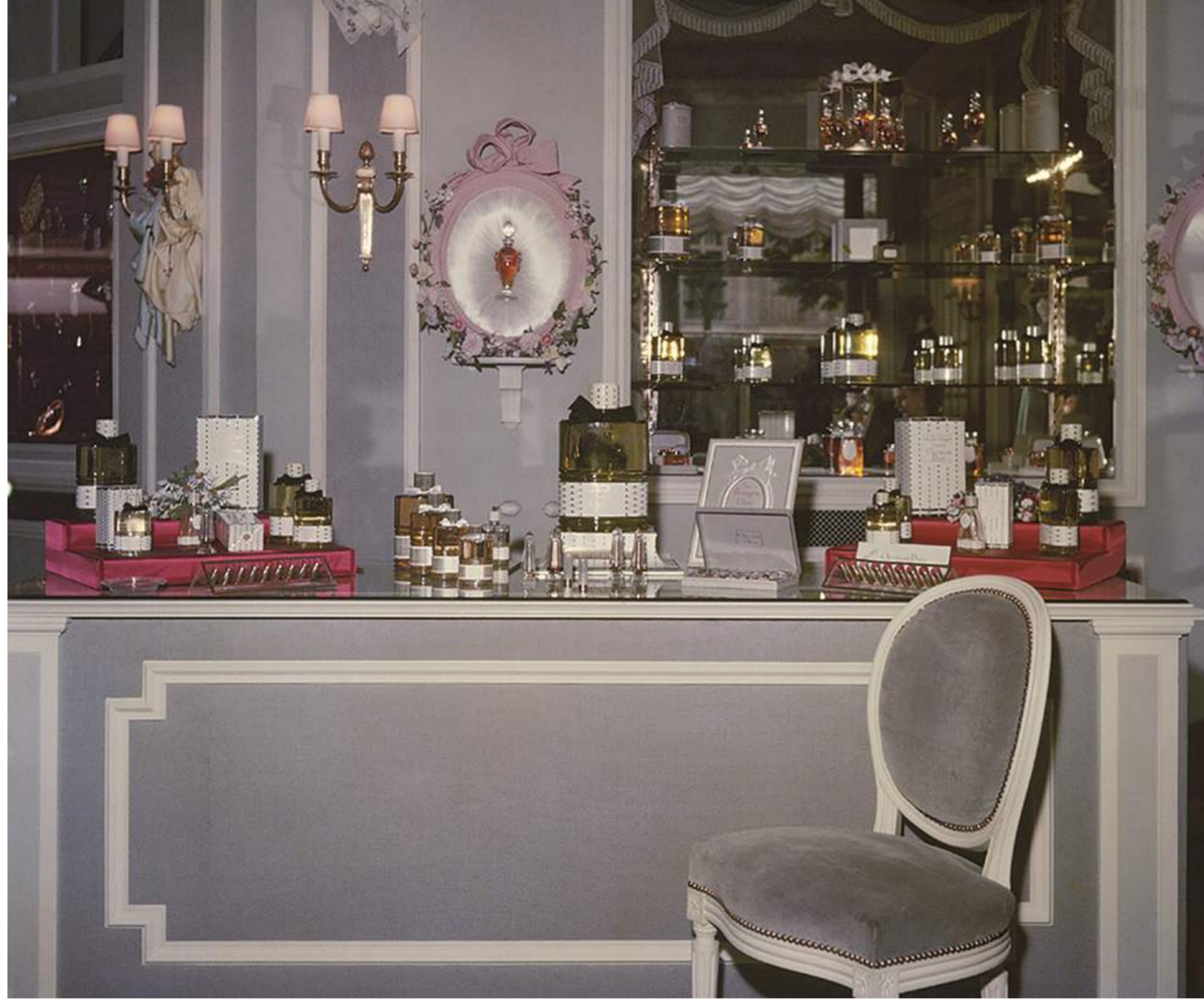
Christian Dior Perfume Boutique